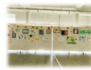
啓発活動の作品の様子です